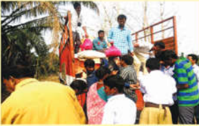
● ఆహారం పంపిణీ