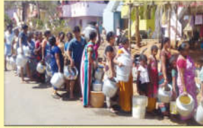
● వాటర్ లిలిఫ్