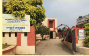
● సులబల్ పాస్పి క్లినిక్