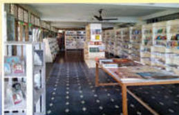
● పుస్తక విక్రయశాల