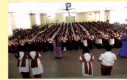
● ప్రార్థన సభ