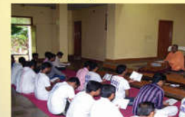
● వ్యక్తిత్వ వికాస తరగతులు