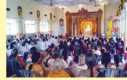
● శ్రీ ప్రార్థనలో భక్తులు