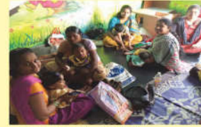
● సులబల్ పాస్పి క్లినిక్ లో పిల్లలు