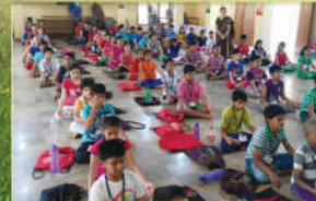
● సమ్మర్ కాంపు