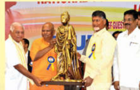
● యువజన దినోత్సవంలో A P ముఖ్యమంత్రి -2016