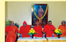
● ఆలయం రజతోత్సవాలు - 2015