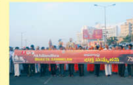
● అమృతోత్సవము - ఊరేగింపు