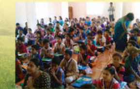
● నైతిక విద్యా కార్యక్రమము