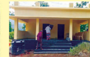
● నాన్ ఫార్మల్ ఎడ్యుకేషన్ సెంటర్ - వాలాబూ