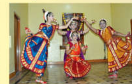
● రజతోత్సవాలలో పిల్లల నృత్యం