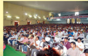
● జాతీయ యువజన దినోత్సవం 2016 - ప్రేక్షకులు