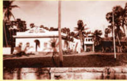
● ఆశ్రమము - 1941