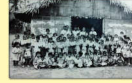
● స్కూలు - 1958