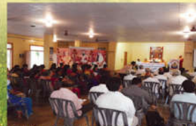
● టీ-చర్చ్ వర్క్ షాపు