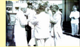
● శ్రీ డా॥ ఎస్. రాధాకృష్ణన్ - 1961