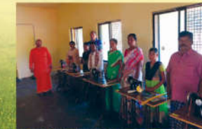
● బైలరింగ్ శిక్షణ