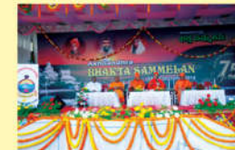
● అమృతోత్సవము - 2014