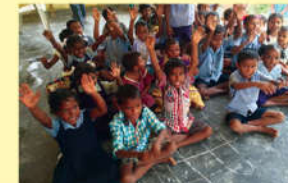
● లంగన్ వాడి