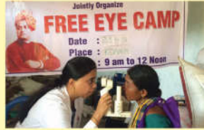
● ఉచిత కంటి చికిత్సా శిబిరం