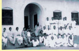
● స్వామి విరజానందజీ - 1946