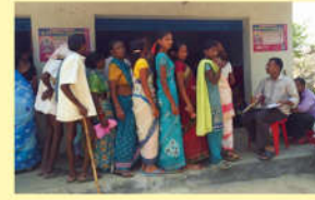
● సంచార వైద్య చికిత్సా సేవ

2011 నుండి 2014 వరకు స్వామి వివేకానంద 150 జిల్లాలలో త్వచాలను ఘనంగా నిర్వహించింది. ఈ సందర్భంగా అనేక కార్యక్రమాలు జరిగాయి. ఆశ్రమం స్థాపించి 75 సం॥లు అయిన సందర్భంలో 2014 లో ఆశ్రమ అమ్మతోత్సవాల సందర్భంగా ఉపాధ్యాయుల వర్క్ షాపు విద్యార్థులకు పోటీలు, యువజన నమ్మకనాలు నిర్వహించబడినవి. స్వామిజీ జీవితం ఉపదేశాలతో కూడిన తోలు బొమ్మలటలు నిర్వహించబడినవి. ముగింపు ఉత్సవాల సందర్భంగా ఆంధ్రా-తెలంగాణ భక్త నమ్మకనం జరిగింది. సుమారు 3000 మంది భక్తులు, 70 మంది సన్యాసులు పాల్గొన్నారు. 2015 సం॥లో ఆలయ సంప్రతికా రజతోత్సవాలు నిర్వహించబడినవి.