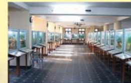
● బొమ్మల ప్రదర్శన