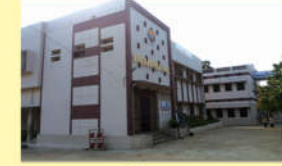
● స్కూలు బల్డింగ్ లు