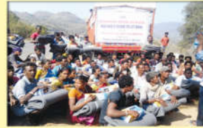
● సోలార్ లైట్ల మరయు దుప్పట్ల పంపిణీ

11. నైతిక విద్యా కార్యక్రమాలు : విశాఖపట్టణం, పరిసర ప్రాంతాల కాలేజీలు, పాఠశాలల్లో నైతిక విద్యపై క్లాసులు, స్వామి వివేకానంద ఆశయాలు, బుద్ధి వికాసం గురించి విద్యార్థులకు అవగాహన కల్పించడం.