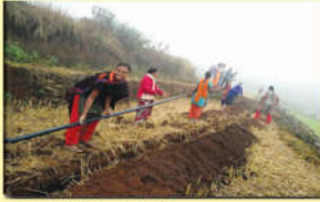
● వాటర్ సస్టైనేబుల్ ప్రాజెక్టు