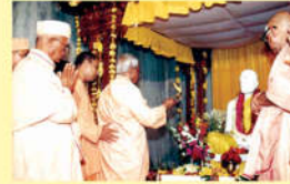
● శ్రీ దేవాలయ ప్రారంభోత్సవం - 1991